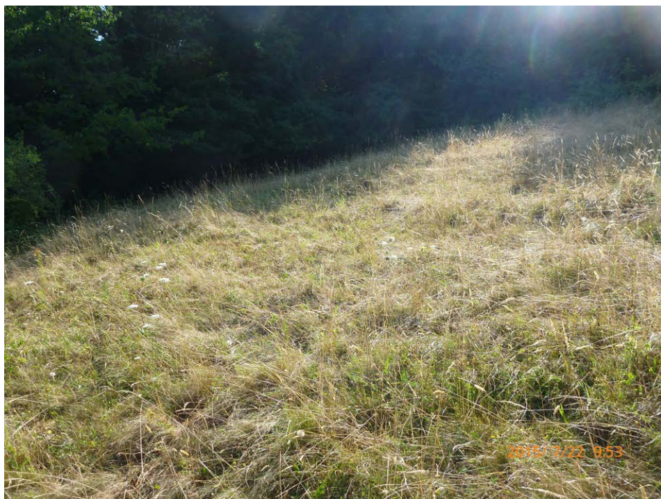
Photo de l'objet 22.07.2015